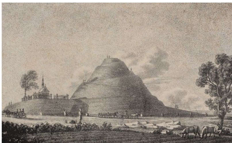
4 Kopiec Kościuszki w Krakowie, po 1823, litografia, 14,8 x 21,9 cm. Biblioteka Narodowa, Warszawa

Sierakowski w swoim traktacie architektonicznym z roku 1812, pisząc o "geniuszu polskim", który przed wiekami zrodził co prawda prymitywny, ale bezkonkurencyjnie trwały sposób upamiętniania 40 .