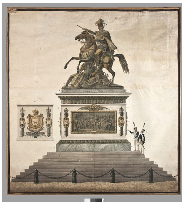
1 Aleksander Orłowski, Projekt pomnika Poniatowskiego, 1818, akwarela, 135 x 123 cm. Muzeum Narodowe, Warszawa

reprezentujące ponadczasowy kanon piękna 18 . Prace nad modelem zakończyły się jednak dopiero w roku 1828. Dotarł on do Królestwa Polskiego rok później i został zaprezentowany publicznie w Warszawie na placu Kasińskich (il. 2). O ile dotychczas ostateczna decyzja komitetu o wyborze antycznego stroju, mimo że anonsowana w prasie, nie budziła emocji, o tyle wraz z udostępnieniem gotowego posągu i wystawieniem go na osąd społeczeństwa okazało się, że dawniejsze niezdecydowanie Mokronowskiego (który zmarł w międzyczasie) miało swoje uzasadnienie. Artystyczna forma stała się bowiem przedmiotem sporu na łamach prasy, który dotyczył adekwatności akademickiego ideału do specyficznego przeznaczenia tej rzeźby jako pomnika publicznego.